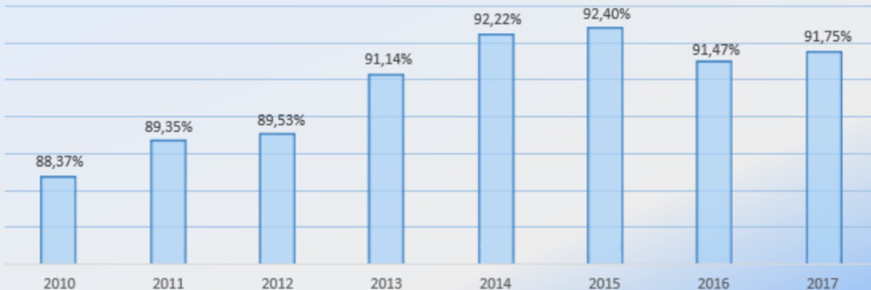
Qualidade da Seleção Grau de Acerto na Seleção de Contribuintes para a Fiscalização